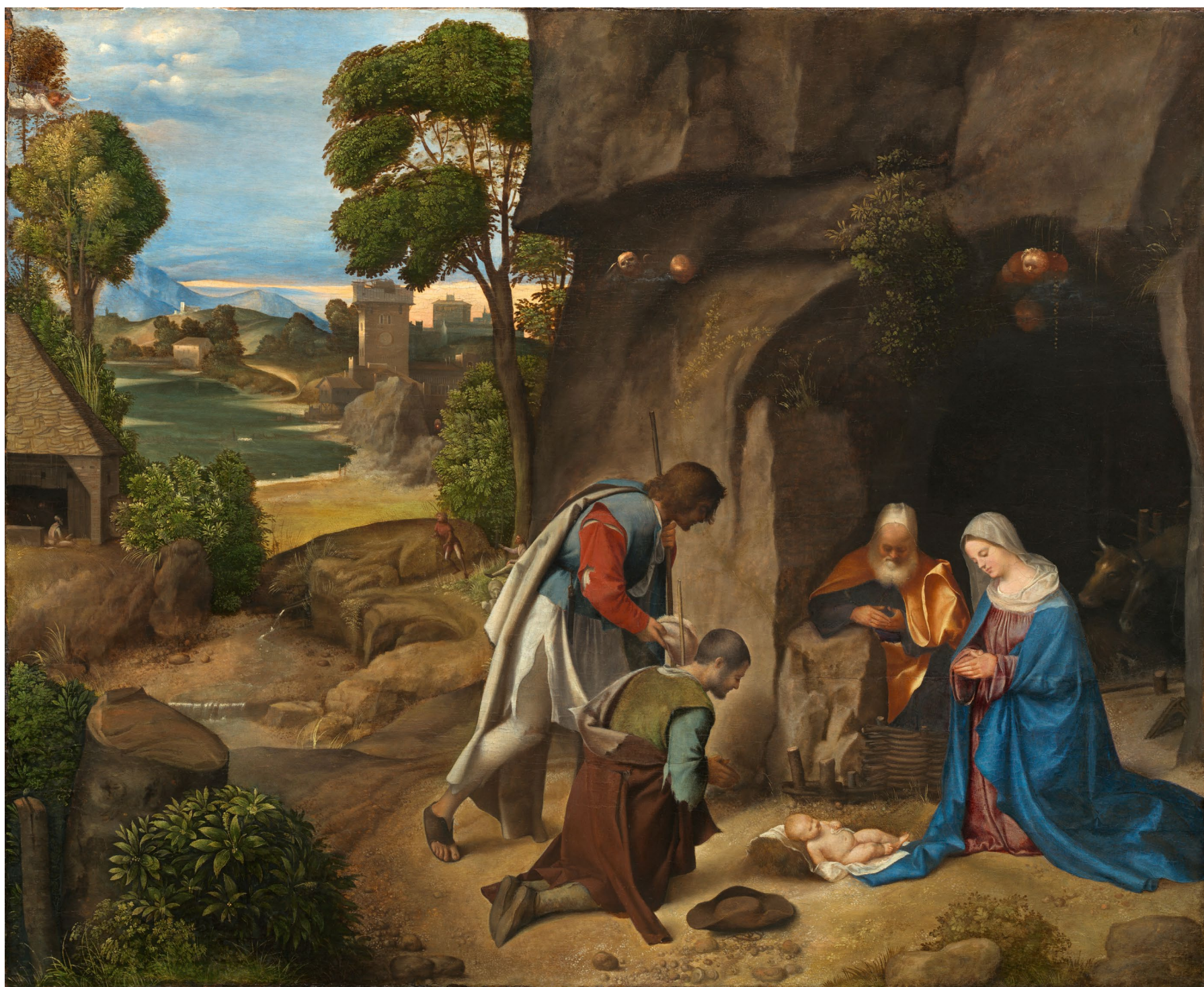
Giorgione, Adorazione dei pastori o Natività Allendale, 1500-1505 circa, olio su tavola, 90,8×110,5 cm; National Gallery, Washington

Se il figlio di Dio avesse avuto dei privilegi, come l'avrebbe potuto accogliere chi ne è privo? Così se avesse avuto possedimenti terreni, schiere di servi al suo servizio, un nome potente e famoso, non avrebbe avuto la libertà luminosa del figlio di Dio, non sarebbe stato un dono di grazia e di vita per ogni essere.