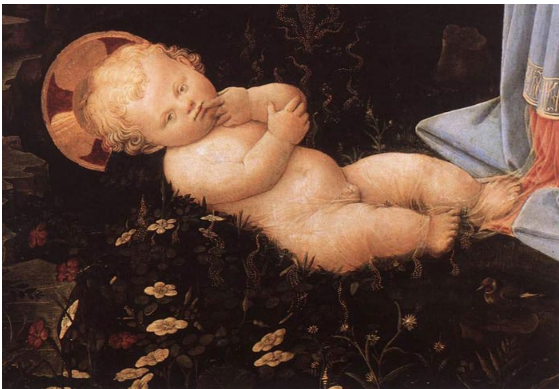
Fra Filippo Lippi, Adorazione del Bambino di palazzo Medici, (dettaglio), tra il 1458 e il 1460, tempera su tavola, Gemäldegalerie, Berlino