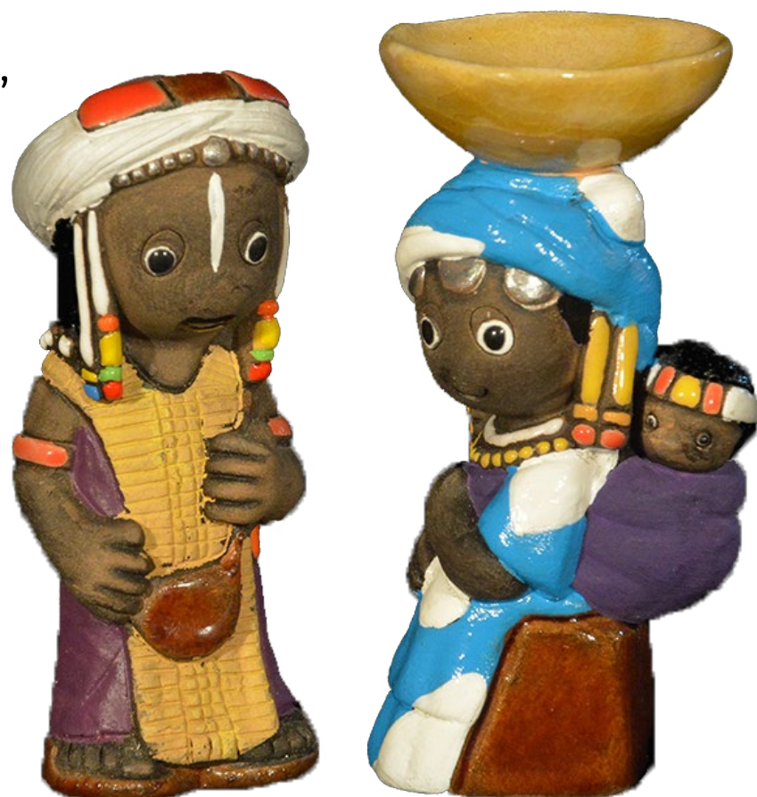
presepe dal Mali

Benedetto sei tu, Sole di Giustizia, che sei uscito dal seno del Padre per illuminare tutto l'universo.