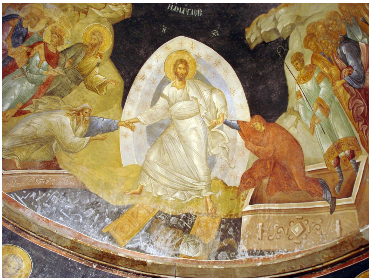
Resurrezione, affresco della chiesa di san Salvatore in Chora a Costantinopoli, sec. XII (Istanbul)